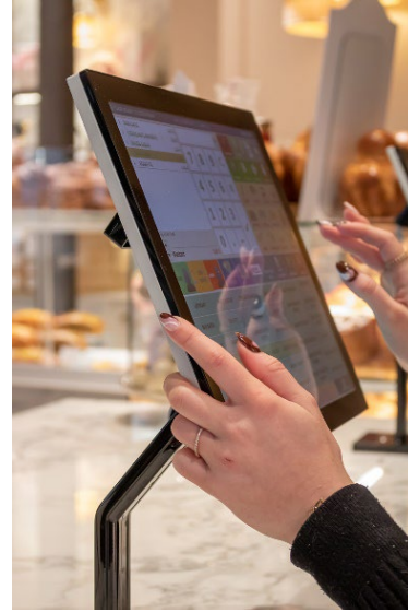
Terminaux JAZZPOLE chez Maison VATELIER (Rouen)