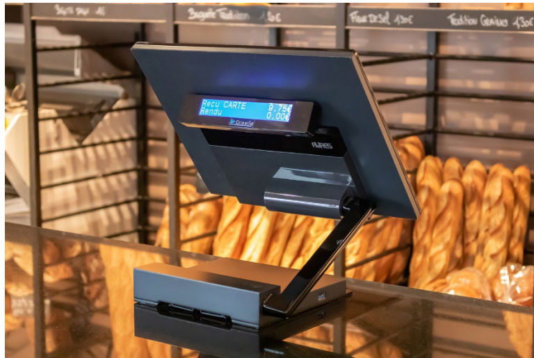
TPV JAZZ chez Maison VATELIER (Quincampoix)