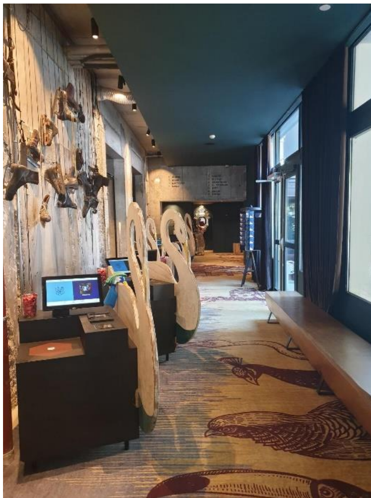
Bornes self-service TABHOTEL/AURES à la « Folie Douce » de Chamonix